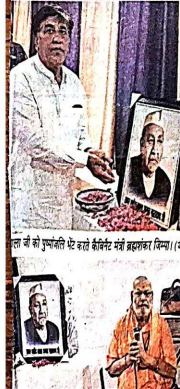
लाला जी को पुण्यतिथि पर दत्त कैंपिटे मंत्रोच्चारण किया।

अमर शहीद लाला जगत नारायण जी की 42वीं पुण्यतिथि पर लगाए गए ब्लड डोनेशन कैम्प के दौरान पाठकों ने जिस तरह से उत्साह दिखाया है, उसके लिए पंजाब केसरी समूह अपने पाठकों और रक्तदानियों का आभारी है। हमारा यह प्रयास है कि देश की एकता व अखंडता को खातिर अपने खून का बलिदान देने वाले लाला जी को इसी तरह समाज सेवा के कार्यों के लिए श्रद्धांजलि दी जाए। इस रक्तदान कैम्प के दौरान रक्तदाताओं ने जिस तरह का उत्साह दिखाया है, वह अपने आप में सराहनीय है और हम अपने वाले वर्षों में भी इस सिलसिले को आगे बढ़ाने की भासक कोशिश करेंगे। मुख्य संपादक